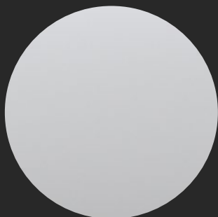
POLAR WHITE TRI METALLIC