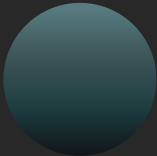
CARRAGEEN METALLIC EXCLUSIVO PARA V-SERIES