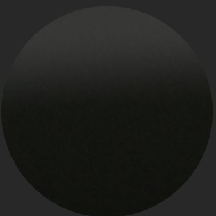
BLACK MEET KEETLE METALLIC