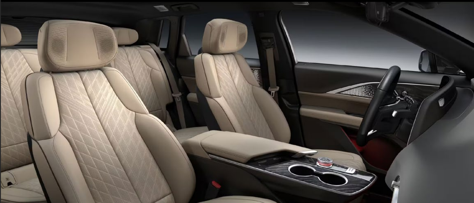
BACKEN BLACK / OXFORD STONE

Imágenes de carácter ilustrativo. Consulta disponibilidad de colores en tu país. Images for illustrative purposes only. See availability of colors in your country.