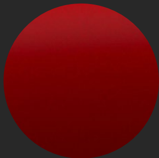
RADIANT RED TINT METALLIC