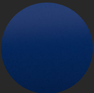
OPULENT BLUE METALLIC