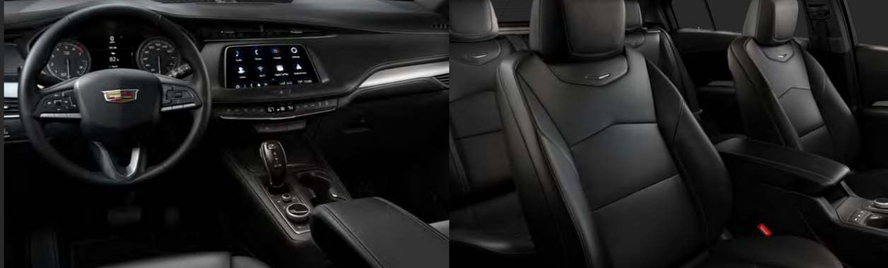
JET BLACK DISPONIBLE EN VERSIÓN PREMIUM LUXURY