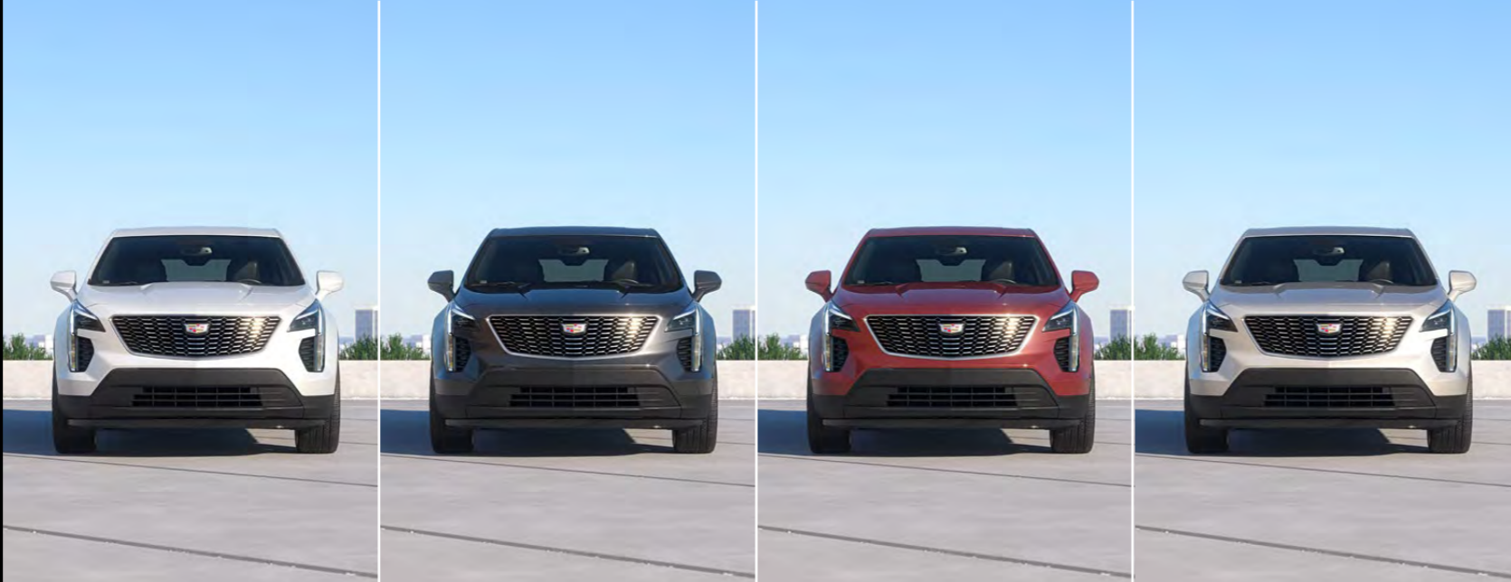
ABALONE WHITE TRICOAT