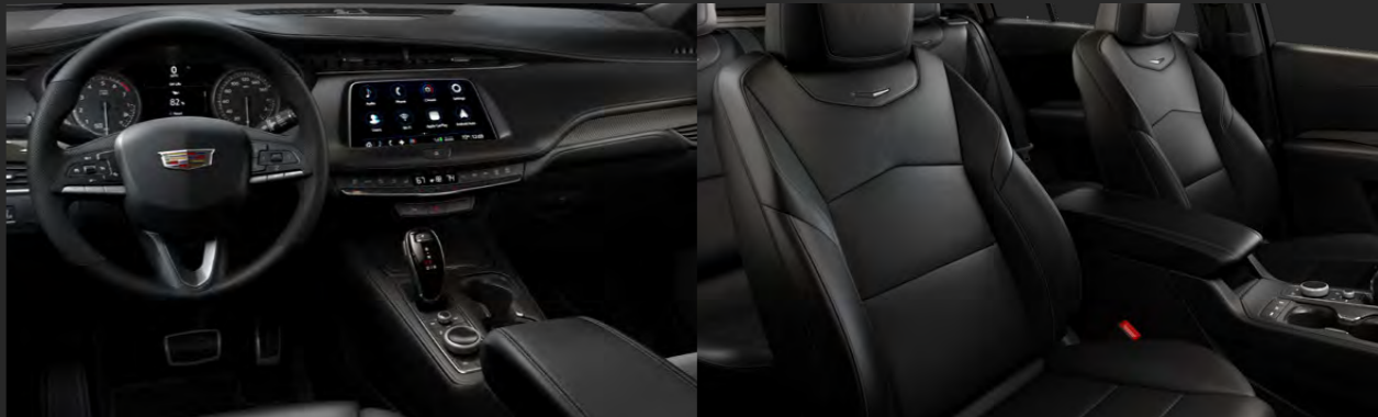
JET BLACK / CINNAMON STITCH DISPONIBLE EN VERSIÓN SPORT