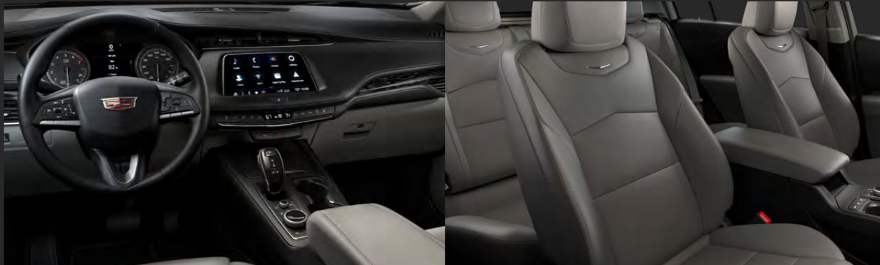
JET BLACK / LIGHT PLATINUM DISPONIBLE EN VERSIÓN PREMIUM LUXURY