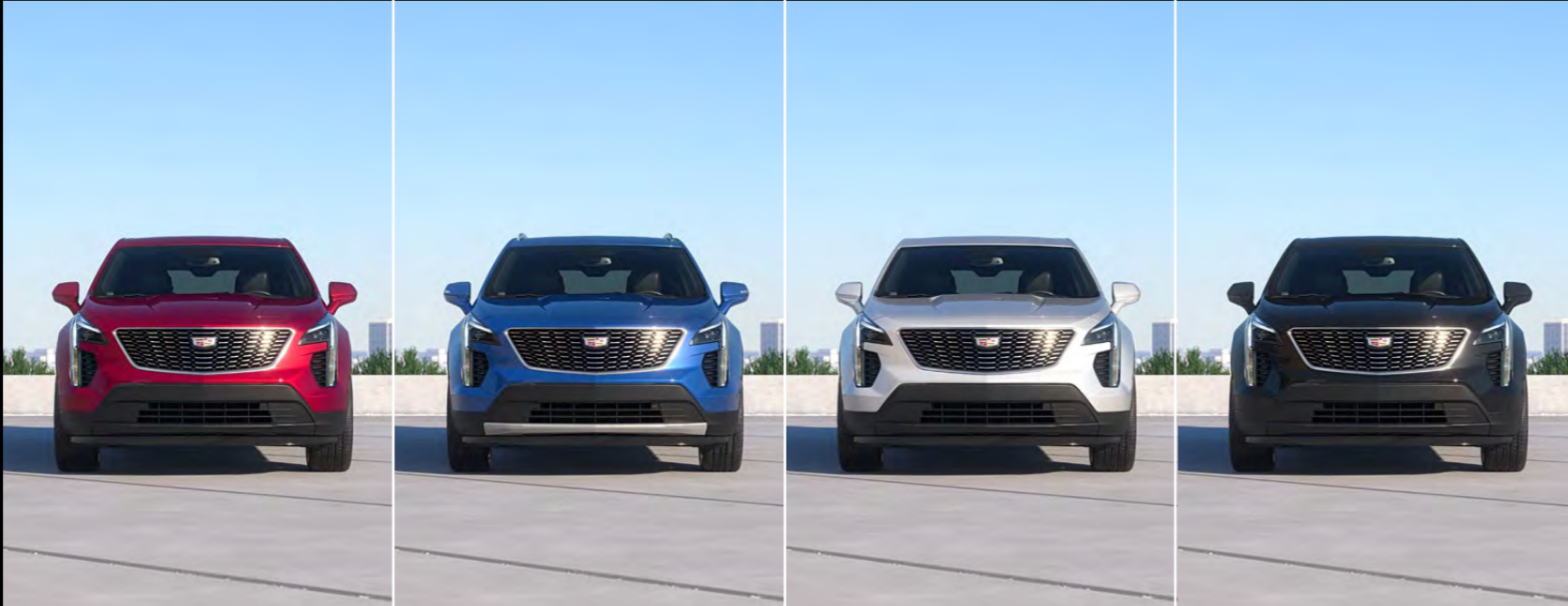
RADIANT RED METALLIC