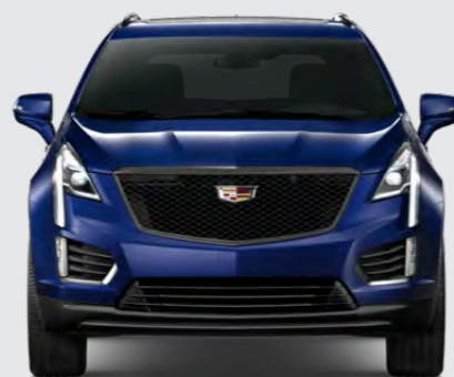
OPULENT BLUE METALLIC