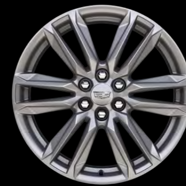
RINES DE ALUMINIO DE 20"