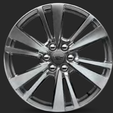
RINES DE ALUMINIO DE 20"