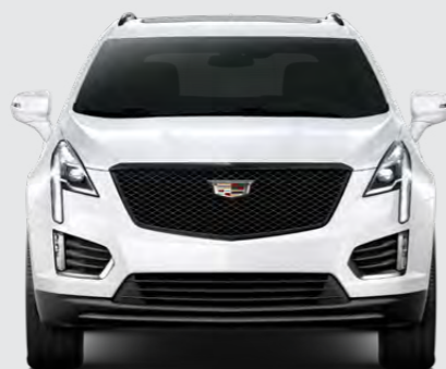
ABALONE WHITE TRICOAT