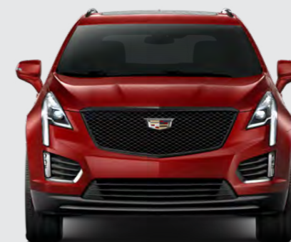
RADIANT RED METALLIC