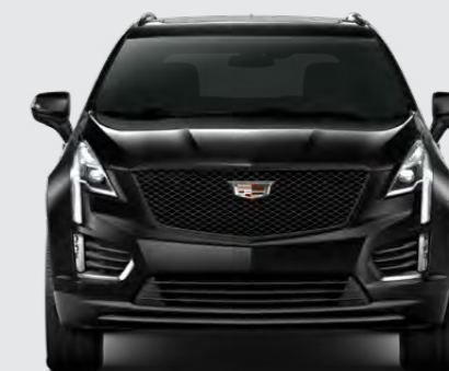
BLACK MEET KETTLE METALLIC